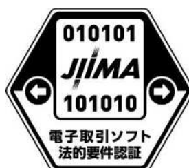
令和2年改正法令基準