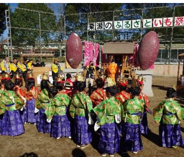
栗源のふるさとイモ祭