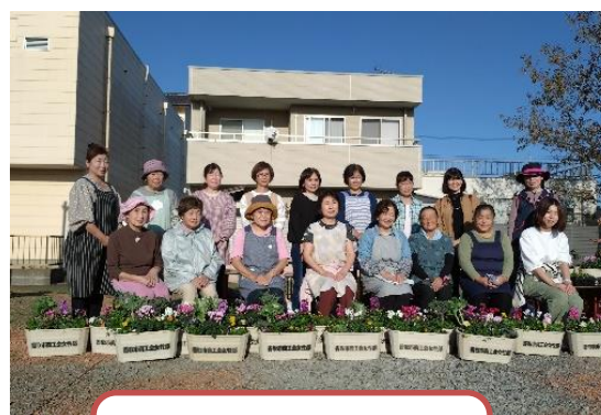
自分たちの作った寄せ植えの前で記念撮影