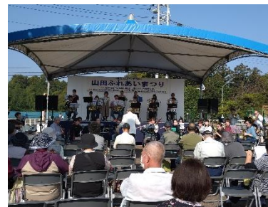
香取のふるさとまつりが完全復活! 山田ふれあいまつり