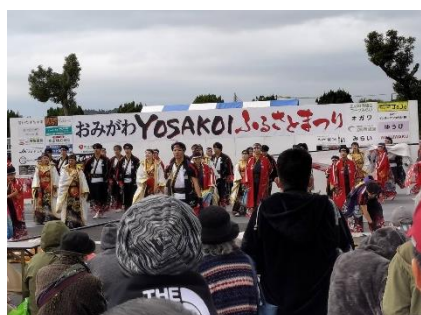
おみがわ yosakoi ふるさとまつり