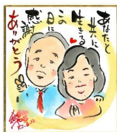
高木商工会長 ご夫妻

夫 妻 大波小波の人生と言 いますが、私達にとつて は小波の人生であったと 思います。平穩に過ぎた 人生は幸せでした。 これからも周りの皆さ んと楽し く元気に 健康寿命 を考えな がら、暮 らしたい です。