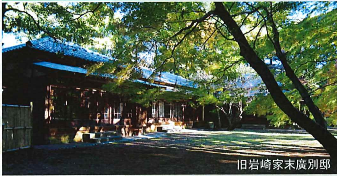
旧岩崎家末廣別邸