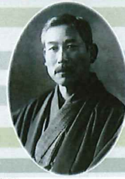
岩崎久彌 (旧三菱財閥第3代総帥 1865~1955) 三菱社長引退後、本格的に農牧事業に携わる。若かりし頃から蓄えた農牧などに関する豊富な知識は末廣・小岩井農場の経営にいかんなく発揮された。